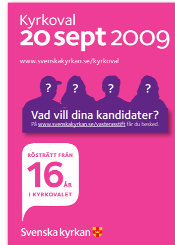
Skiss på hur en annons kan se ut.

Från och med lördagen den 27 juni kommer du att kunna lägga upp information på Västerås stifts Valwebb. Den 24 augusti släpper vi in allmänheten på valwebben och då måste allt vara klart.